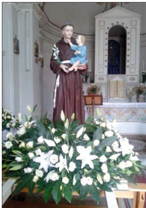
La Statua di Sant'Antonio venerata a "Belfiore".

Da principio monaco agostiniano a Coimbra dal 1210, poi dal 1220 frate francescano. Nel 1221 si recò al Capitolo Generale ad Assisi, dove vide e ascoltò di persona san Francesco d'Assisi. Antonio fu incaricato dell'insegnamento della teologia e inviato dallo stesso san Francesco a contrastare la diffusione dell'eresia catara in Francia. Fu poi trasferito a Bologna e quindi a Padova. Morì all'età di 36 anni. È notoriamente e popolarmente considerato un grande santo, anche perché di lui si narrano grandi prodigi miracolosi, sin dai primissimi tempi dalla sua morte e fino ai nostri giorni. Tali eventi prodigiosi furono di tale intensità e natura