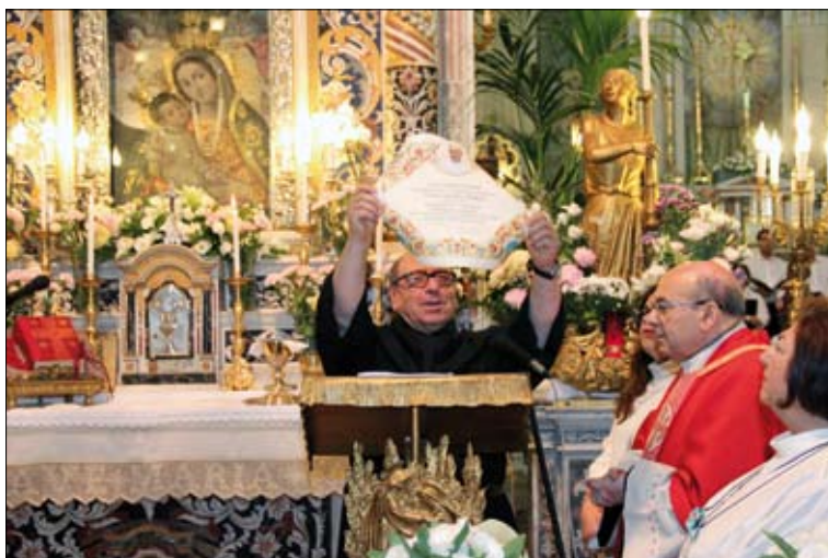
La "Pergamena" con la Benedizione del Papa.

Ma la circostanza di oggi ci invita a riflettere con gratitudine sulla sublime grandezza del sacerdozio ministeriale, istituito da Gesù, e da Lui lasciato come