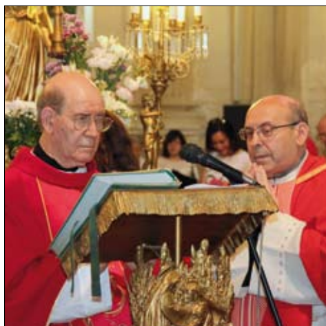
Inizia la santa Messa.