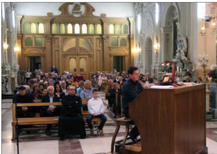
Il Maestro all'Organo.

torato di Ricerca in Storia ed analisi delle culture musicali presso l'Università degli studi di Roma "La Sapienza". Si è perfezionato in organo e clavicembalo presso l'Accademia di musica italiana per organo di Pistoia, la Norddeutsche Orgelakademie di Bunde (Amburgo) e l'Università di Santiago de Compostela. Attivo come or-