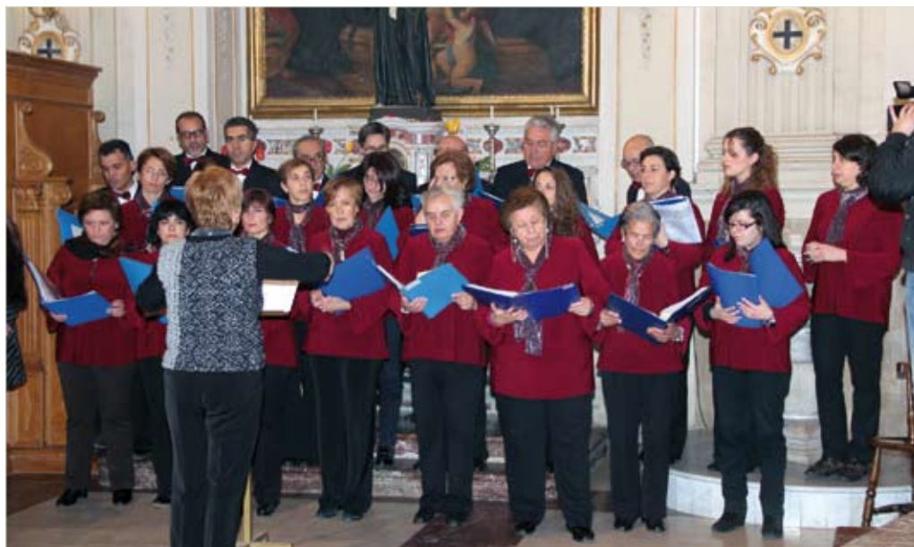
La Corale Polifonica "S. Agostino".

vatore che ha presentato al Vescovo la realtà della Parrocchia, impegnandosi a «non far rumore» ma ad essere sempre in ascolto della voce della Chiesa e della Diocesi, in particolare, perché così facendo si è sicuri di conseguire lo scopo della missione pastorale.