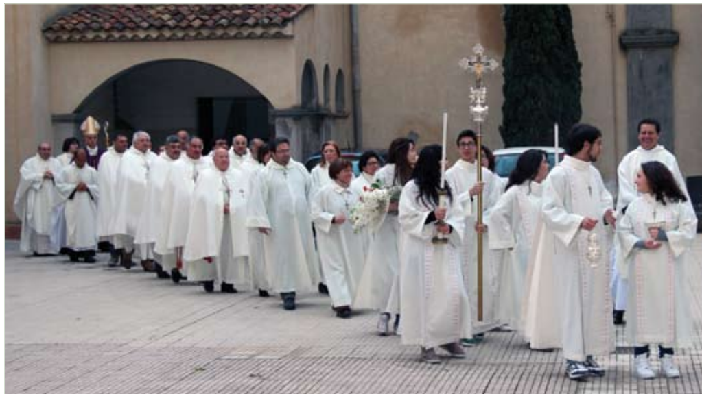
In processione verso il Santuario.